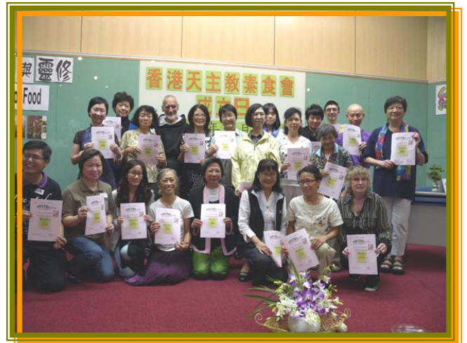
23 人全部 5 次出席獲頒證書。