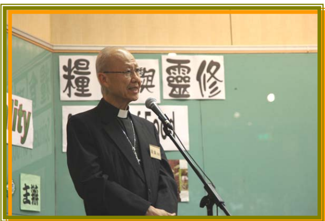
湯漢主教蒞臨出席 10 月 16 日下午舉行最後一天的研討會，並偕與會嘉賓及講者為「香港天主教素食會」的成立作啟動禮及致辭，當天出席嘉賓及參加者超過 200 人，約 60 多人進行「愛主愛人愛大地」承諾。