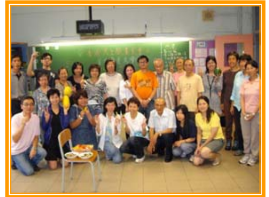
<<<< 香港天主教素食會第一屆幹事會成員